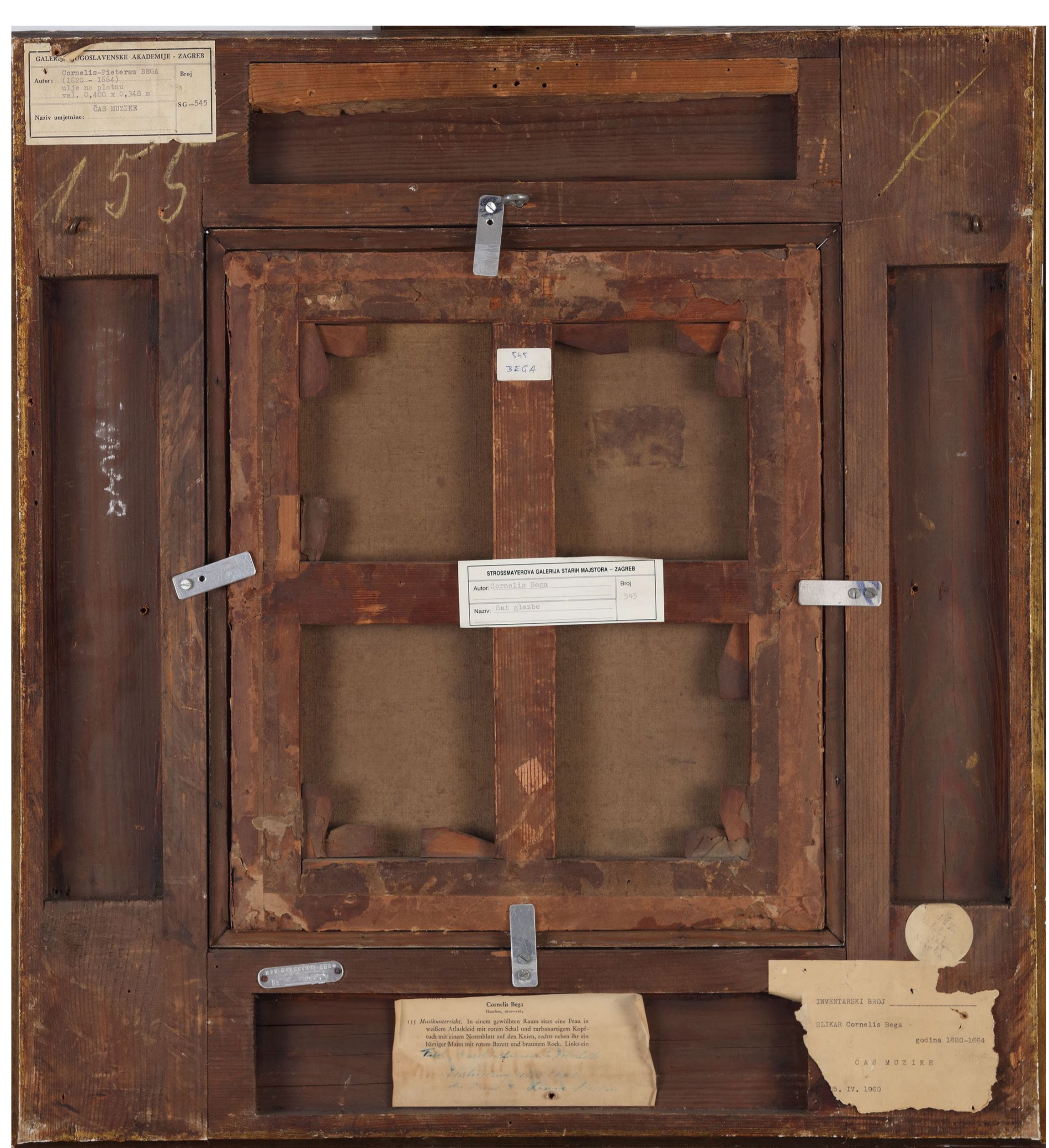
Poledina slike Sat glazbe Back of the painting Music Lesson