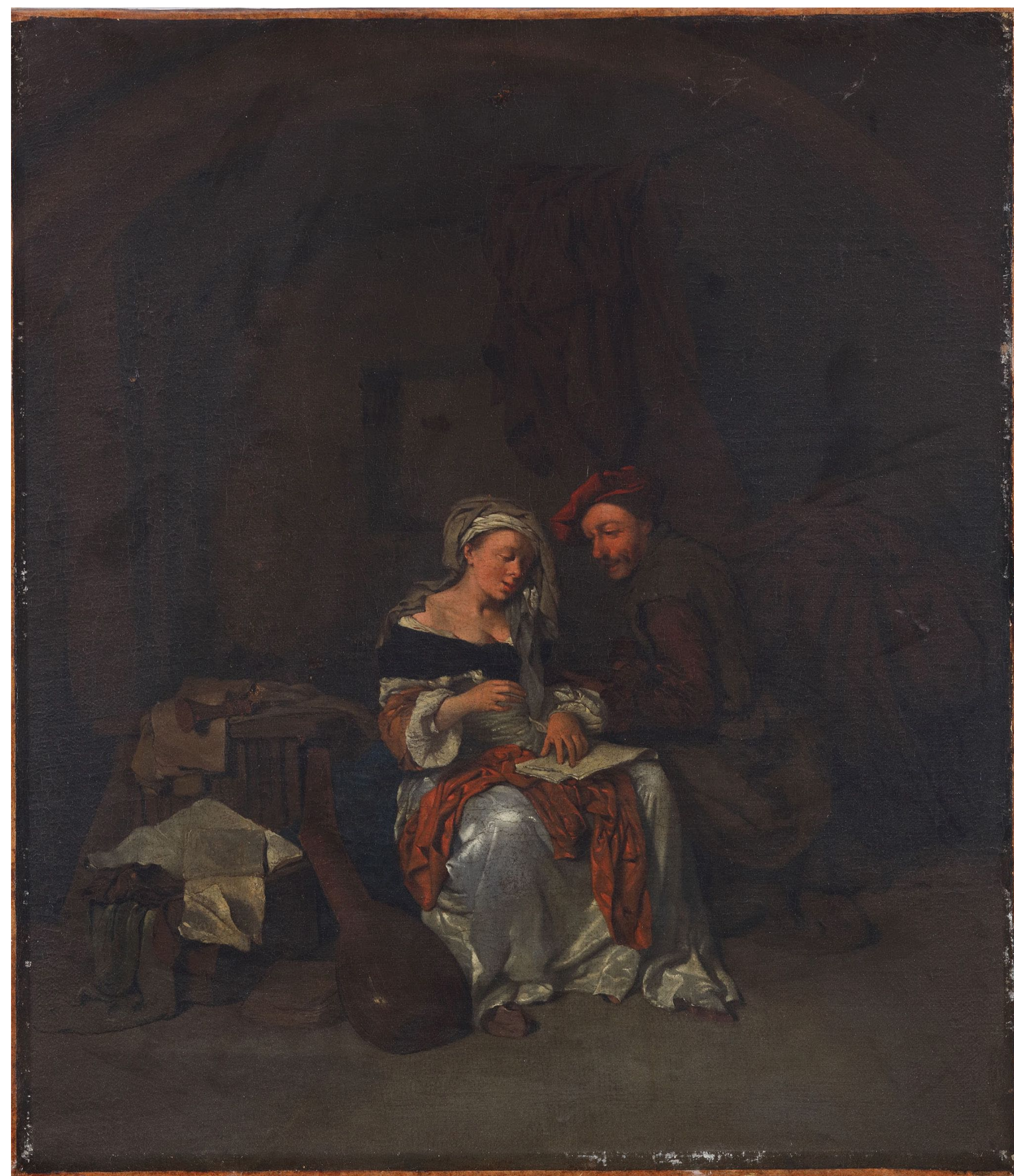
Prema: Cornelis Bega, Sat glazbe, nakon 1663., ulje na platnu, 40 x 34,8 cm, Strossmayerova galerija starih majstora HAZU, inv. br. SG-545. After: Cornelis Bega, Music Lesson, after 1663, oil on canvas, 40 x 34.8 cm, Strossmayer Gallery of Old Masters, inv. no. SG-545.