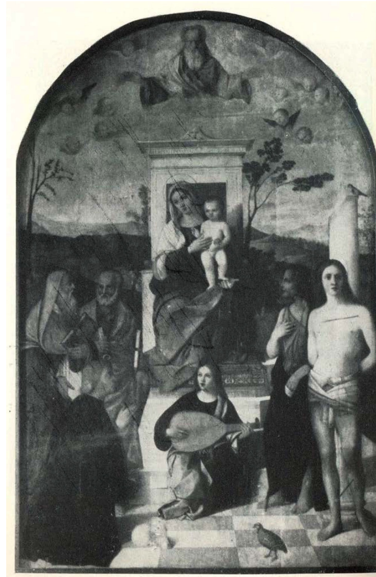
Francesco Bissolo, Bogorodica na prijestolju sa četiri sveca, anđelima i donatorom , 16. st., crkva sv. Marije, Lastovo (izvor: Cvito Fisković, Lastovski spomenici, Prilozi povijesti umjetnosti u Dalmaciji, 16/1966) Francesco Bissolo, Madonna on the throne with four saints, angels, and donor , 16th c., Church of Our Lady, Lastovo (source: Cvito Fisković, Lastovski spomenici, Prilozi povijesti umjetnosti u Dalmaciji, 16/1966)

Hrvatski državni arhivu u Splitu - Arhiv Oblasnog narodno-oslobodilačkog odbora - Prosvjetni odio: Cvito Fisković, Dalmatinski spomenici i okupator, Split, 1946.; Cvito Fisković, Lastovski spomenici, 1966.; Serena Brunelli, I piani di protezione antiaerea e il ruolo delle Soprintendenze marchigiane a Zara: cronistora di un Ventennio (1925-1945 circa), Le Voci del Museo, 34, 2015.; Arsen Duplančić i Radoslav Tomić, Zbirka slika Arheološkog muzeja u Splitu, Split, 2004.; Joško Kovačić, Franjevački samostan i crkva u Hvaru, Zagreb, 2009.