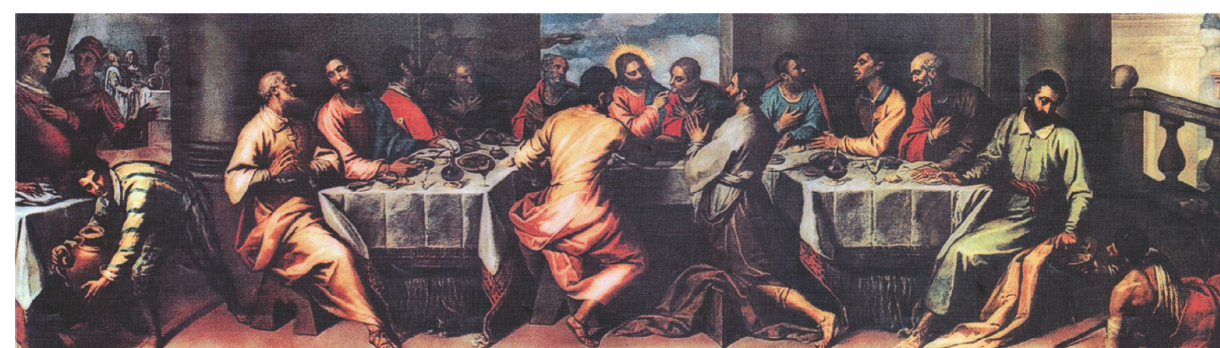
Jacopo Negretti (Palma Mladi) i Matteo Panzoni, Posljednja večera , Franjevački samostan u Hvaru Jacopo Negretti (Palma the Younger) and Matteo Panzoni, The Last Supper , Franciscan Monastery in the City of Hvar