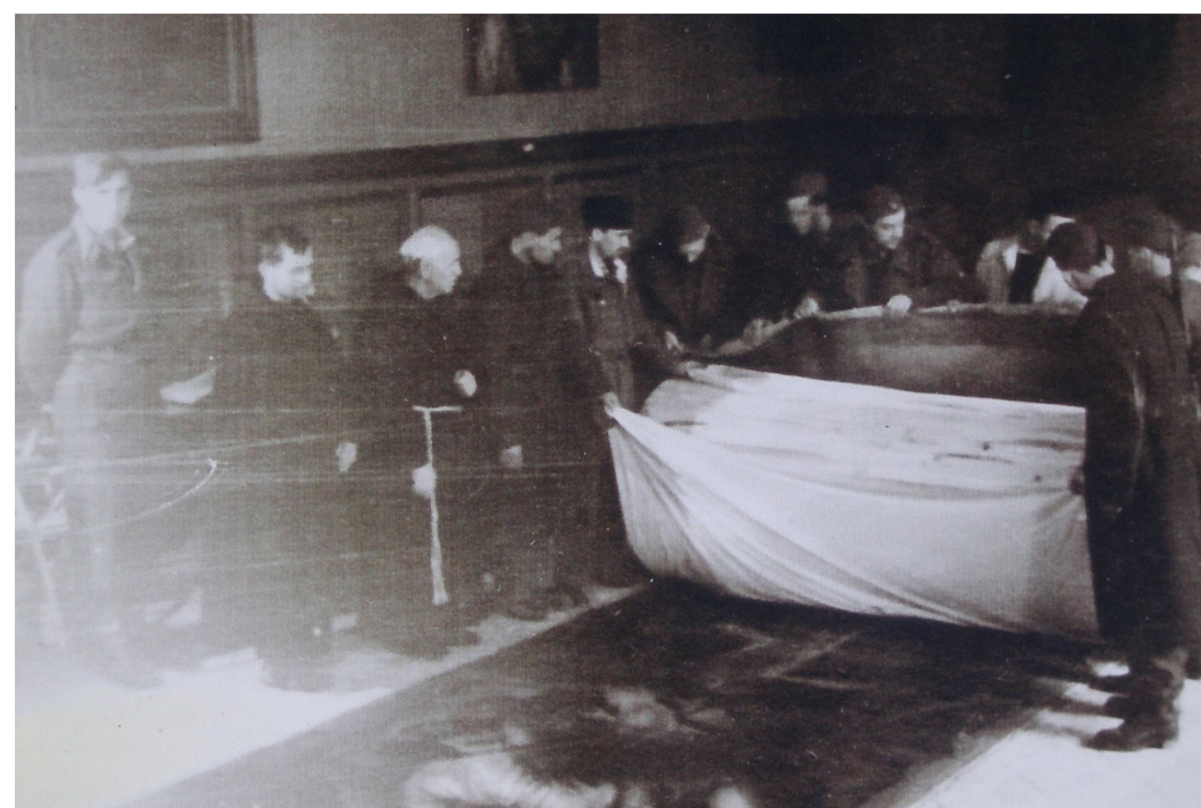
Evakuacija Posljednje večere tijekom Drugog svjetskog rata Evacuation of The Last Supper during World War II