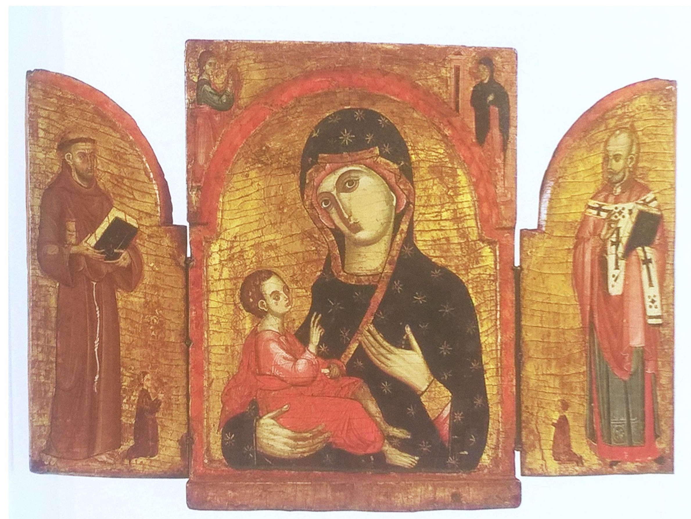
Triptych Bogorodice sa sv. Antom i sv. Franjom , 14. st., Arheološki muzej u Splitu The Madonna with Saint Anthony and Saint Francis triptych , 14th c., Archeological Museum in Split